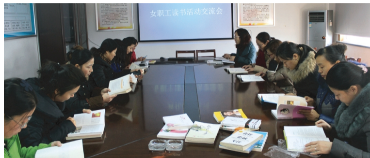
为进一步提高女职工的思想素质、文化素质。近日,黄化制钙公司工会组织开展了“女职工读书交流会”活动,引导女职工读好书、善读书、爱读书,树立“学习才能进步,学习才能创新,学习才能有所作为”的思想观念。大家结合自身的阅读体验,共同交流了于丹的《趣味人生》、《品味书香》、《杨澜访谈录》等读书心得并进行了互评。(刘凡榕)

行为约束“有规矩”。坚持对照六中全会审议通过的“准则、条例”规定,及时修订完善《徐圩投资公司党员干部廉洁自律“十项规定”》纪律制度,并以红头文件形式印发各单位、部门学习领会、遵照执行,对落实不到位导致出现“节日病”等问题的单位或部门,严肃追究当事人责任和单位领导责任。(叶维友)