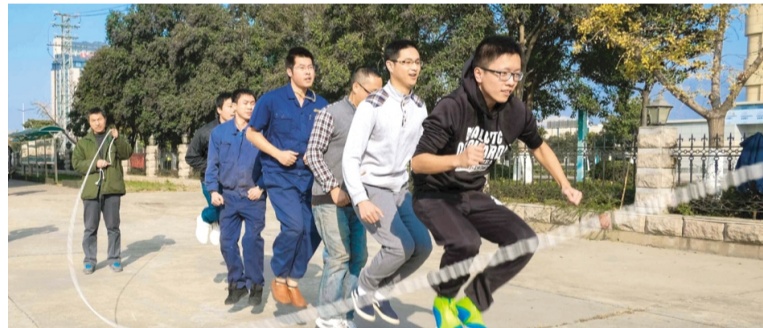
为丰富职工文化生活,调动生产积极性与团队协作性,增强职工身体素质,日前,氨纶公司工会举办了冬季跳绳比赛,100多名职工报名参加。通过跳绳比赛将积极健康的生活方式深入职工内心,将团队协作与竞争意识融入工作之中。(冯诗然 姜海虹)