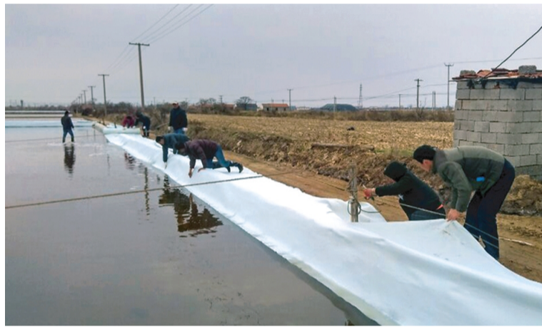
12月12日下午,徐圩深港服务党支部针对新滩服务区“人力少、时间紧、任务重”的原料盐基地建设现状,组织12名党员志愿者到新滩服务区开展“志愿服务”活动,帮助6个单元突出实施土工布贴护工程,完成14条900米泥涂土工布贴护工作,深受新滩干群一至赞许。