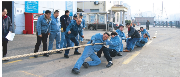
12月10日,泰乐化学公司开展第八届职业素质暨体育运动会系列活动,来自该公司的60余名职工参加了活动,此次活动内容有拔河、绑腿跑、多人跳绳、单人跳绳、码桶、擗蛋、运气球、踢毽子等,对提高职工健康素质,营造“我运动,我健康”的企业氛围起到积极的促进作用。图为拔河比赛现场。(黄鑫)