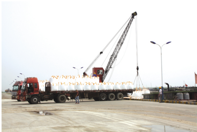
国庆节日期间,灌西物资物流码头五灌河码头生产经营不停,全体员工坚守岗位忙碌,不分昼夜确保第一时间完成装卸任务。假日期间,码头完成装卸量8000余吨。(季兴胜)

10月3日,强降雨过后,悦升保洁公司职工按时到岗,进入道路日常清扫工作状态,巡视人员分片督查到现场,提醒保洁职工增强自我安全保护意识。环卫公司职工始终坚持在小区、厂区等垃圾清理岗位上,定期清运产生生活垃圾。瑞南养护公司组织30名职工轮流对绿化树木进行支架养护。悦升总部结合各分公司职工在岗工作实际,加大各层面巡查人员蹲点巡查力度,抽调62名专业人员成立7支应急保障队,负责各节假日期间应急事件处理工作。(徐宣 悦升 服务 供水)