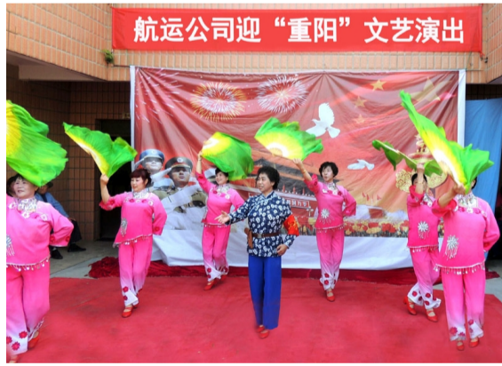
金秋十月,九九话重阳。为弘扬中华民族敬老爱老的优良传统美德,营造尊老、助老的氛围,10月6日,航运公司开展慰问困难独居老人、座谈会、文艺演出等形式,喜迎重阳节的到来。图为离岗退休职工自编自演的“迎重阳、庆佳节”文艺演出现场。