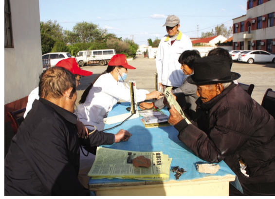
为弘扬中华民族“敬老、爱老”的优良传统,增强社区居民尊老爱老意识,在重阳节来临之际,灌西青年志愿者服务队到灌西医院开展“敬老、爱老、重阳节健康义诊咨询活动”。短短一个小时,活动受众就超过100人次,发放健康知识手册等材料200多份。(西团 封扬)