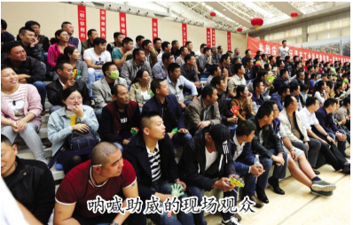
呐喊助威的现场观众