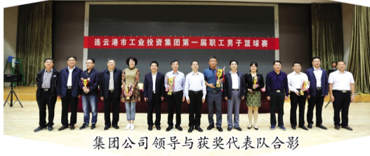
集团公司领导与获奖代表队合影